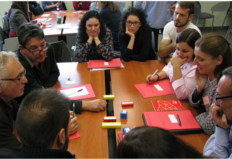
Jornada de Networking a Flix entre joves i empreses (Consorci Intercomarcal d'Iniciatives Socioeconòmiques)

Projecte pel retorn de joves al món rural