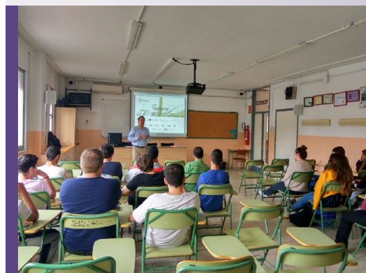
Taller ODISSEU a l'INS Montsià d'Amposta (Consorci per al Desenvolupament del Baix Ebre i Montsià)