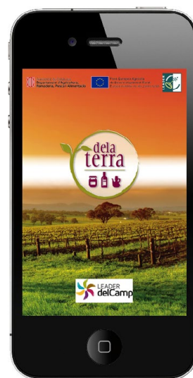
APP de la terra (Consorci Leader de Desenvolupament Rural del Camp)