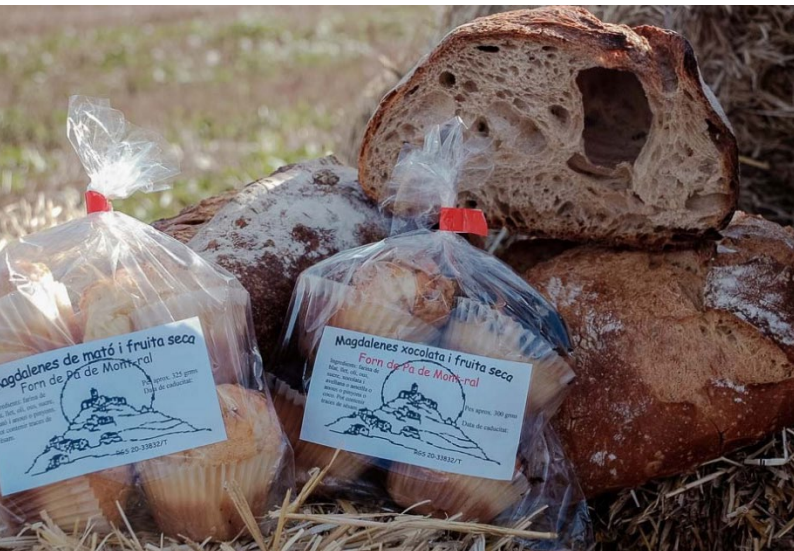
Mostra de producte local (Associació FET A L'ALT CAMP)