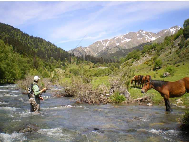
Pràctica de la pesca recreativa (Marc Vande Vliet)