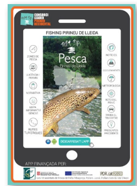
APP "Fishing Pirineu de Lleida" (Consorci Leader Pirineu Occidental)